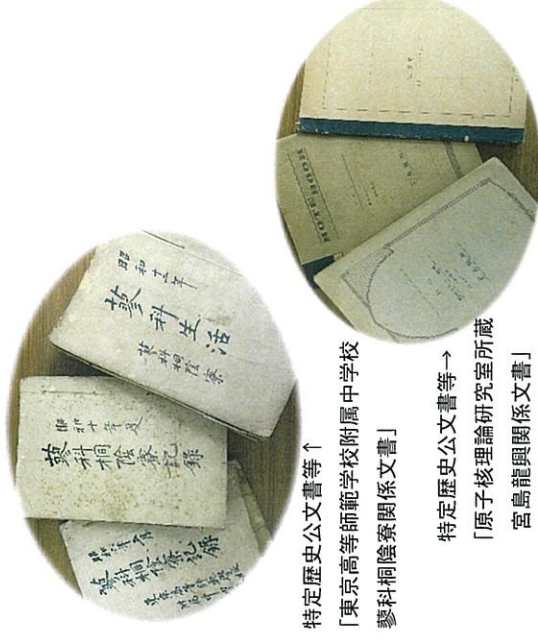
特定歴史公文書等↑